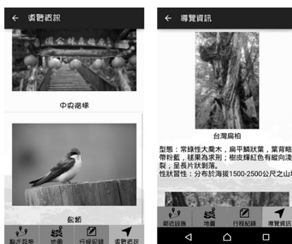
1號標誌點導覽資訊