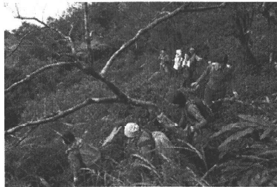
▼八里灣山攀登活動