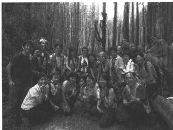
▼溪頭三妹攀登活動-忘憂森林