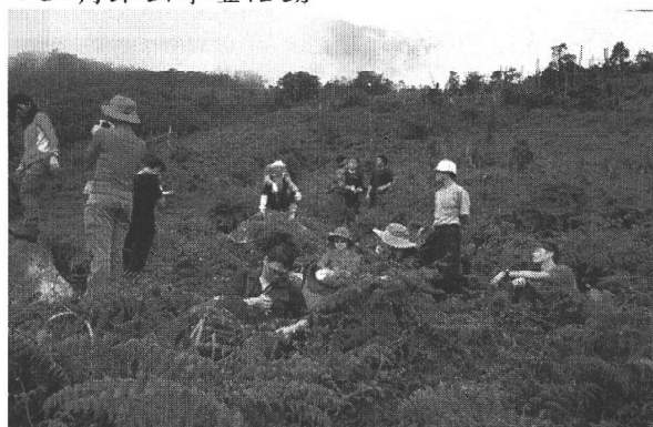
▼三角錐山攀登活動