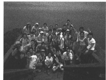
▼霞喀羅古道+觀霧自然之旅