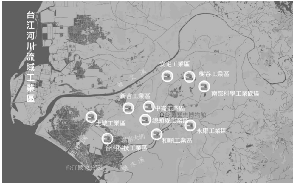
圖 1：台江流域工業區分布圖

其中和順、總頭、中崙及安定等四座工業區未設污水處理廠，對台江流域及生活環境影響甚鉅，特別是位於台南市安南區安順國小的空污測站記錄，2014 年安南區 PM10 污染全國排名十名內，空污十分嚴重 8 。